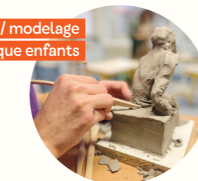
Sculpture / modelage pratique enfants