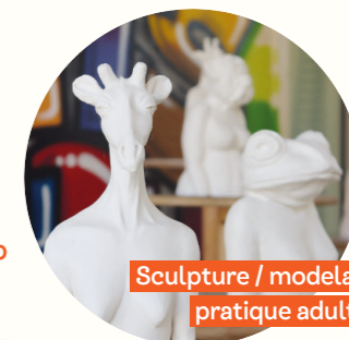
Sculpture / modelage pratique adultes

Stages aquarelle 2 jours En automne et au printemps !!!