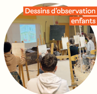
Dessins d'observation enfants