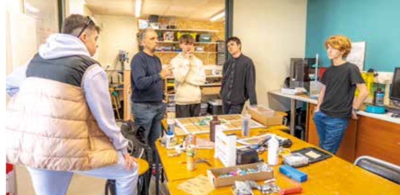
Les porteurs du projet Brawl Stars en plein brainstorming.